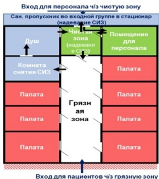
Схема модульного инфекционного стационара